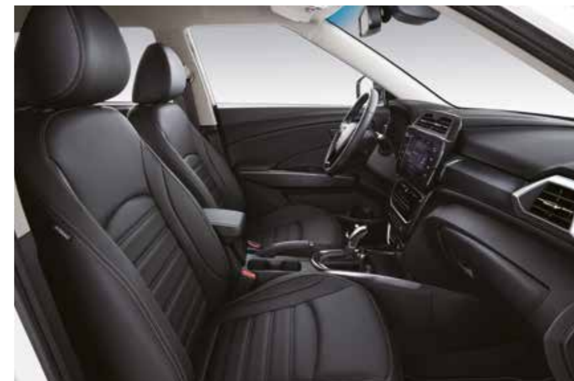
INTERNI NERI (LBH)