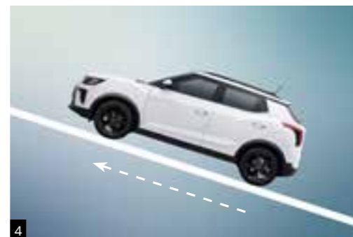
1 Protezione antibaltamento (ARP) 2 Segnale di arresto di emergenza (ESS) 3 Sistema di Controllo in Discesa (HDC) 4 Assistenza alla partenza in salita (HSA)