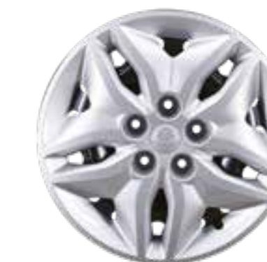
16" cerchi in acciaio

Immagini puramente illustrative; gli equipaggiamenti possono variare a seconda dei mercati. Maggiori dettagli presso le concessionarie.