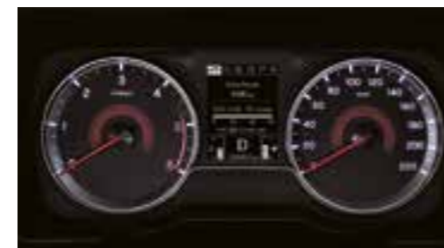
Quadro strumenti standard

RENDERE LA VOSTRA GUIDA PIÙ INTELLIGENTE, PIÙ FACILE E PIÙ CONFORTEVOLE.