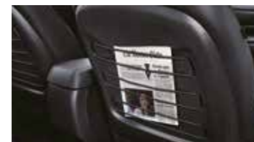
Portamappa con cordino elastico sui retro dei sedili