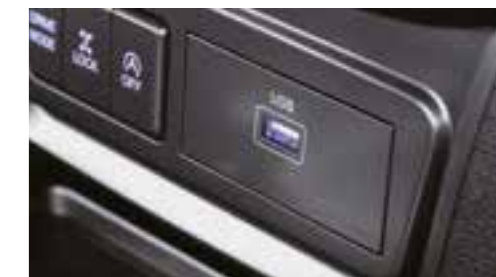
Slot di memoria USB