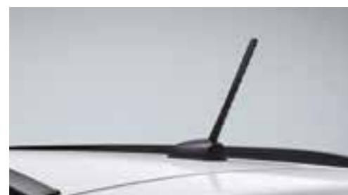
Antenna a asta montata sul tetto