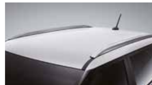
Barre sul tetto cromate di design