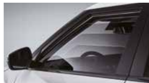
Finestrino del conducente a comando elettrico di sicurezza