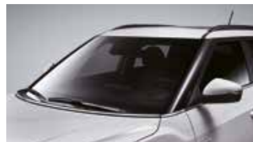
Modanature cromate lungo la linea di cintura e il cofano motore