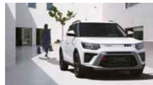
Funzione di chiusura automatica