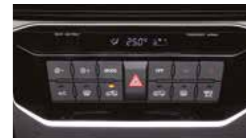
Climatizzatore automatico bi-zona