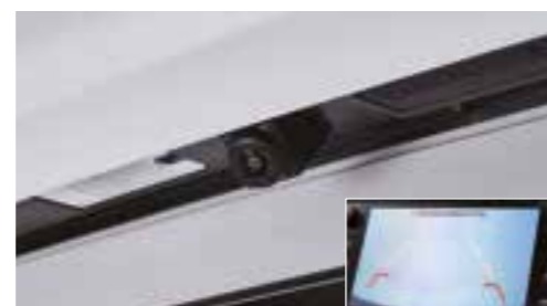
Telecamera posteriore e monitor