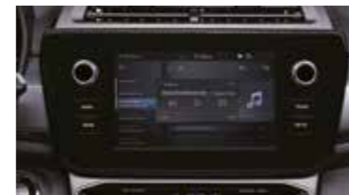
Smart Audio touch screen 8"