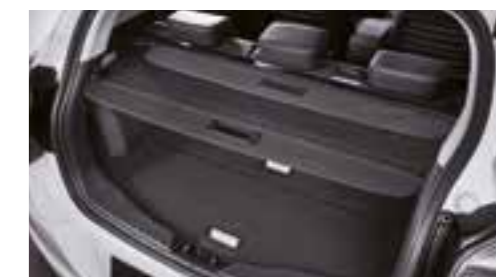
Copertura del bagaglio del vano di carico