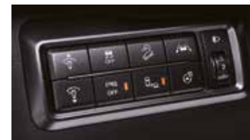
Consolle con più interruttori