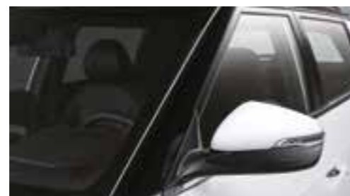
Finitura nera lucida sul montante A