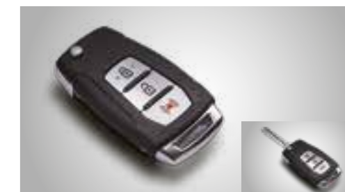
Telecomando apertura e chiusura porte