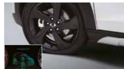
Sistema di monitoraggio pressione pneumatici (TPMS)

RENDERE LA VOSTRA GUIDA PIÙ INTELLIGENTE, PIÙ FACILE E PIÙ CONFORTEVOLE.