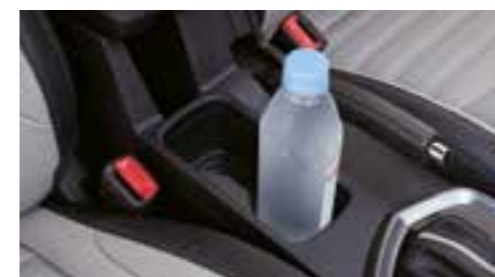
Consolle centrale con doppio portabicchieri