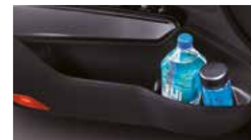
Tasche portamappa di grande capacità sulle portiere